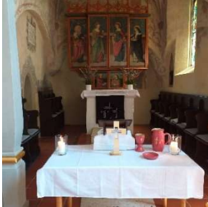
Karfreitag – „Also hat Gott die Welt geliebt“