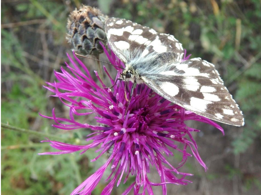
Ein Schachbrettfalter auf der Blüte einer (Skabiosen-) Flockenblume