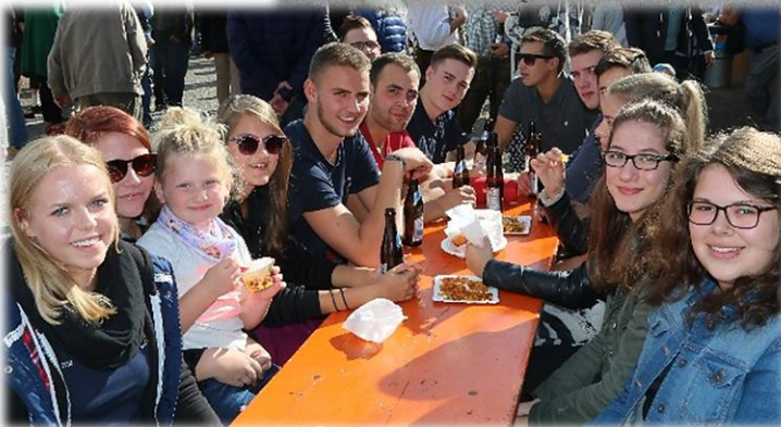
Die ELJ vor ihren Stand mit leckeren Kartoffelchips und Eis