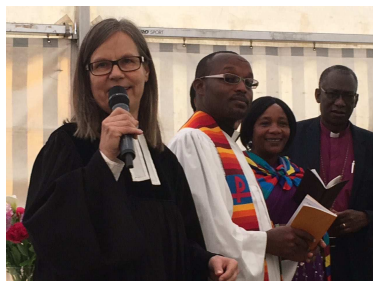
Dekanatskirchentag in Södelbronn mit Bischof und Dekan