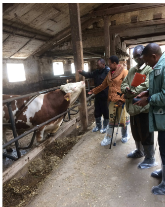
In Horabach bei Langenbuch

Ein wichtiges Thema: Die unbedingt zu reformierende Landwirtschaft am Kilimanjaro. Die Größe der deutschen Rinder gab den Gästen immer wieder Anlass zu allerhöchstem Erstaunen.