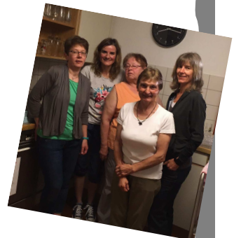
Einige der beteiligten Mitarbeiterinnen...