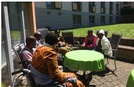
Nachdenken im Seniorenzentrum der Diakonie