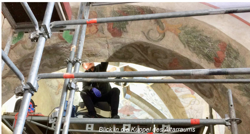
Blick in die Kuppel des Altarraums