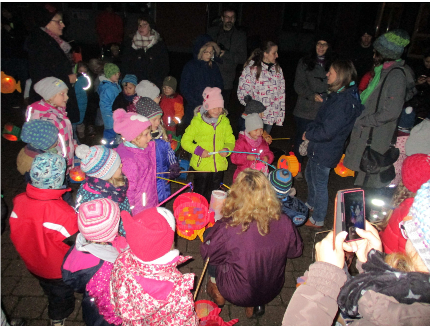
Foto online nicht einsehbar

Im Kindergarten machten wir es uns bei Punsch und mitge- brachten Leckereien gemütlich.