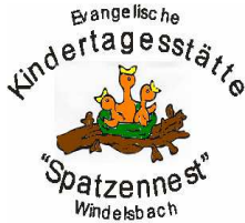
Foto online nicht einsehbar

„Lichterkinder auf dieser Erde, leuchten wie Sterne am Himmelszelt! So wie St. Martin schenken sie Freude In alle Herzen auf dieser Welt!“